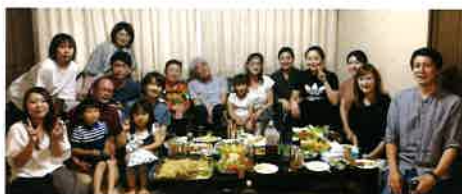
社宅でのモンゴル料理パーティの1コマです